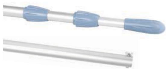
Manche télescopique. Réf. 44009