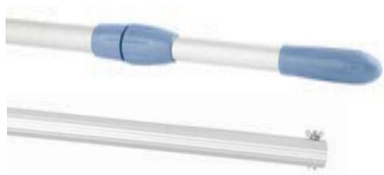
Manches télescopiques. Réf. 44007 et 44008