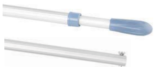
Manches télescopiques. Codes 38424 et 38425